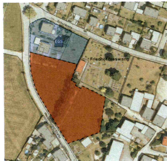
Lageplan mit Flächenumfang des Geltungsbereichs Blau = rechtskräftige Einziehungssatzung „Weißburger Straße“ Rot = Erweiterungsbereich „Weißburger Straße II“

Der Entwurf der Einziehungssatzung „Weißburger Straße II“ im Ortsteil Bieswang, bestehend aus Planblatt, Satzung und Begründung in der Fassung vom 04.04.2024 sowie die nach Einschätzung der Gemeinde wesentlichen, bereits vorliegenden umweltbezogenen Stellungnahmen werden gemäß § 3 Abs. 2 BauGB in der Zeit